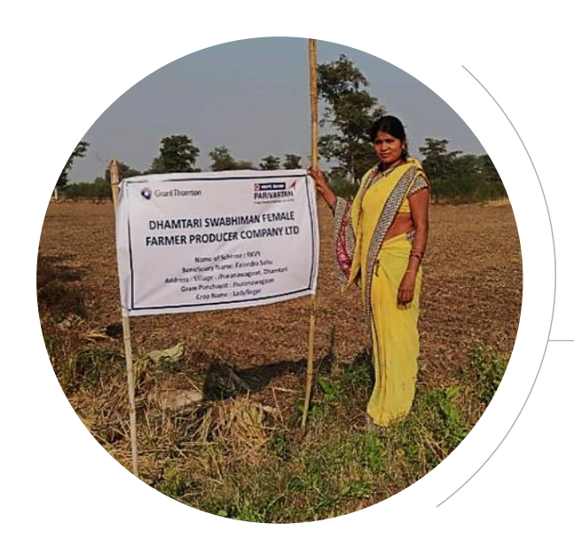
महिला किसान उत्पादक कंपनी की प्रतिनिधि भिंडी फार्म पर