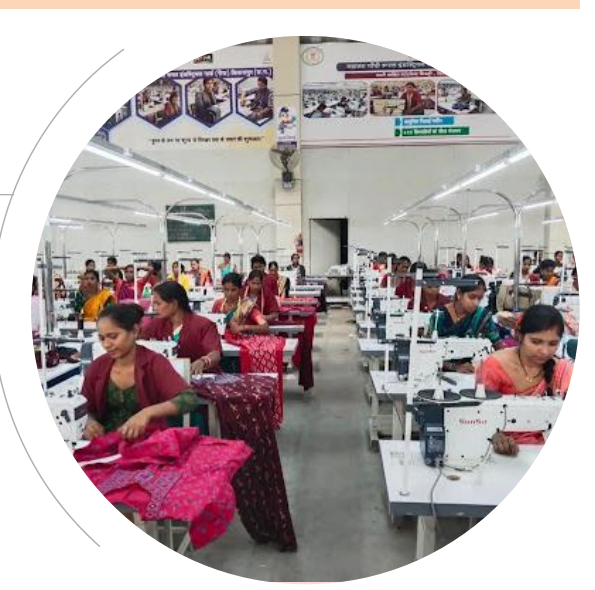
Women artisans at the Rural Industrial Park

RIPAs are a flagship initiative of the Chhattisgarh government, which IMEDF is a Technical Support Agency in three districts. These initiatives are focused on creating sustainable livelihood models and ensure villagers do not have to step out and RIPA would provide the necessary resources. Along with the collection of raw materials, the locals are earning more from value addition