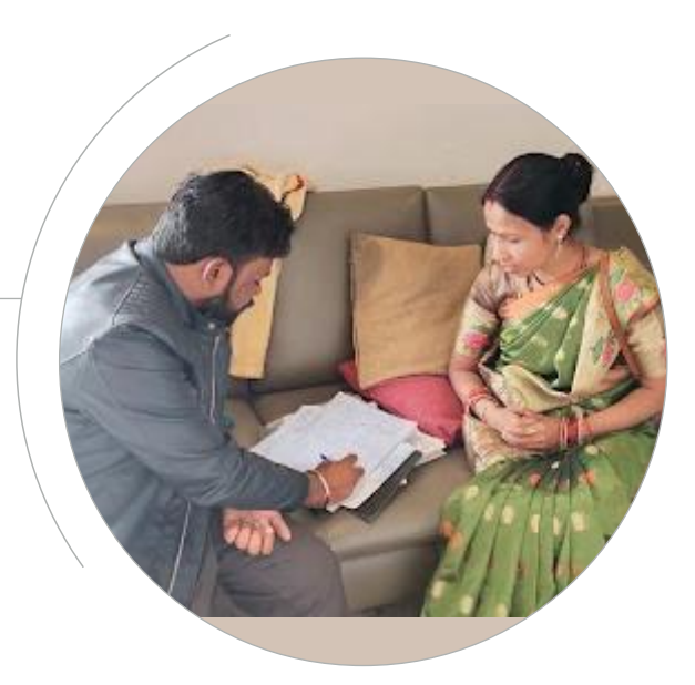
उद्यमी वाणी पर स्वयं सहायता समूह के सदस्य बातचीत करते हुए