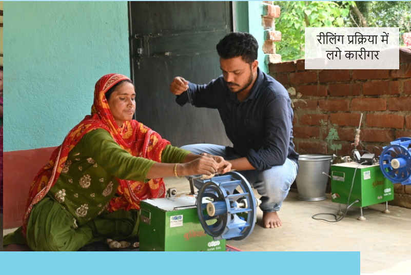
रीलिंग प्रक्रिया में लगे कारीगर