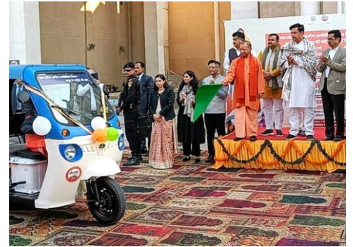
उत्तर प्रदेश के माननीय मुख्यमंत्री श्री योगी आदित्यनाथ ने लखनऊ में योगी बाबा गंभीरनाथ प्रेक्षागृह में महिला चालित ई-रिक्शा को हरी झंडी दिखाकर रवाना किया।

यह पहल आई. एम. ई. डी. एफ के मूल संगठन डी. ए. की एक मजबूत उद्यमी पारिस्थितिकी तंत्र बनाने के लिए अटूट प्रतिबद्धता का प्रमाण है। यह मिर्जापुर में महिला ई-रिक्शा मालिकों के 115 मजबूत आर्या नेटवर्क के अग्रणी कार्य पर आधारित है। हम उत्तर प्रदेश राज्य ग्रामीण आजीविका मिशन के सहयोग से 100,000 महिला स्वामित्व वाले उद्यमों के माध्यम से 2026 तक उत्तर प्रदेश में 300,000 नौकरियां पैदा करने का प्रयास कर रहे हैं, इस प्रकार महिलाओं के लिए निर्वाह आधारित आय सृजन गतिविधियों से अवसर संचालित उद्यमिता की ओर परिवर्तन का मार्ग प्रशस्त कर रहे हैं।