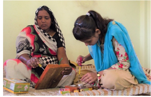
हमारा डिजिटल प्लेटफॉर्म www.udyaME.in

आई. एम. ई. डी. एफ की क्षमता निर्माण वर्टिकल - 50+ संगठनों की क्षमता चार ऑनलाइन कार्यशालाओं (3 घंटे) के माध्यम से बनाई गई है: